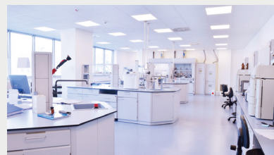
第三方检测实验室