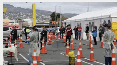
疫情突发地区筛查